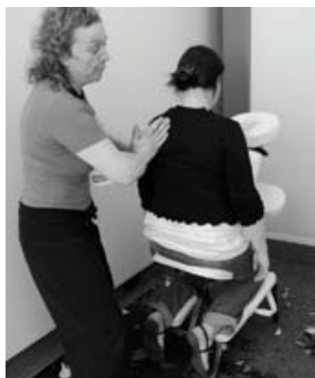
A l'Espace Marine : super-cool !