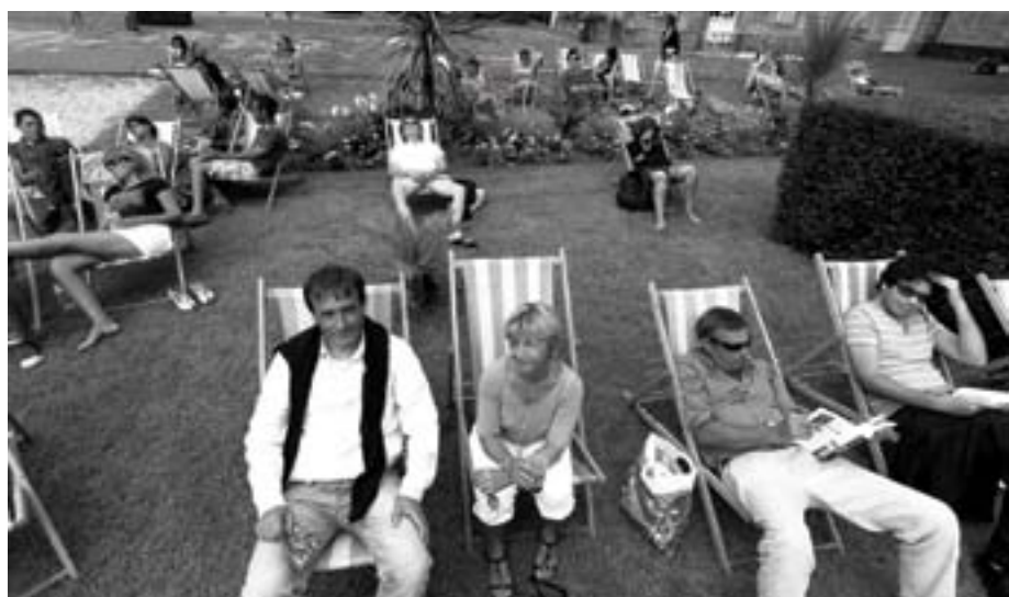
Sur le pont d'un paquebot ? Non, à l'Hôtel Gabriel.