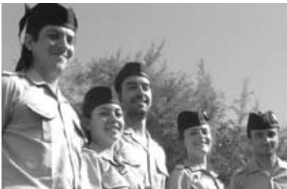
Tous les cinq sont étudiants et passionnés de musique celtique.

Mais comment s'est formé le pipe band San Patricio et qui en sont les membres ?