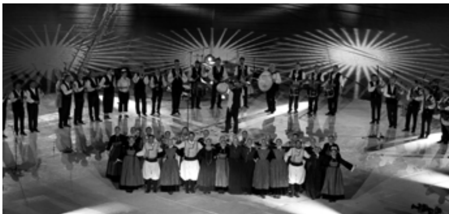
Les sonneurs et les danseurs de la Kevrenn Alre qui a fêté ses 60 ans, cette année.

Puis, le bagad de Lann-Bihoué fait son entrée sous les acclamations des spectateurs. Le cercle Armor Argoat danse avec les sonneurs tous les soirs, histoire de se mettre dans l'ambiance. A partir de 23h, une délégation de chaque pays se succède : Irlande, Asturies, Galice, Ecosse, Pays de Galles, et pour finir en beauté, la Kevrenn Alre pour représenter la Bretagne.