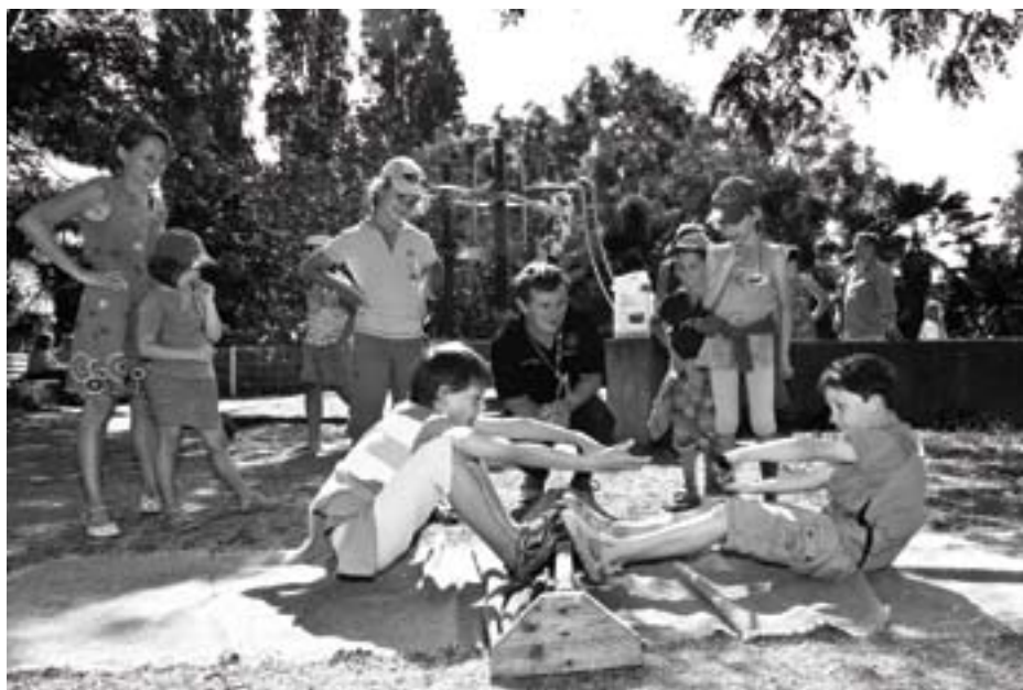
Le «Baz Yod», le «bâton de bouillie» : même en 2011, le plaisir est le même.