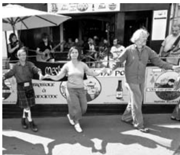
Et dans les rues, on continue à danser...