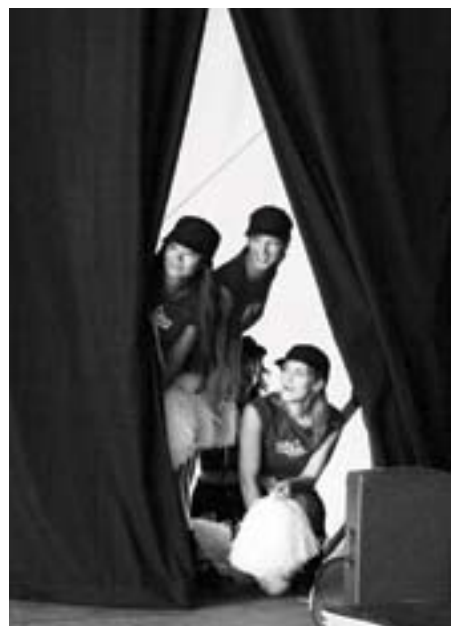
Les «pom pom girls» de la Kitchen Music.