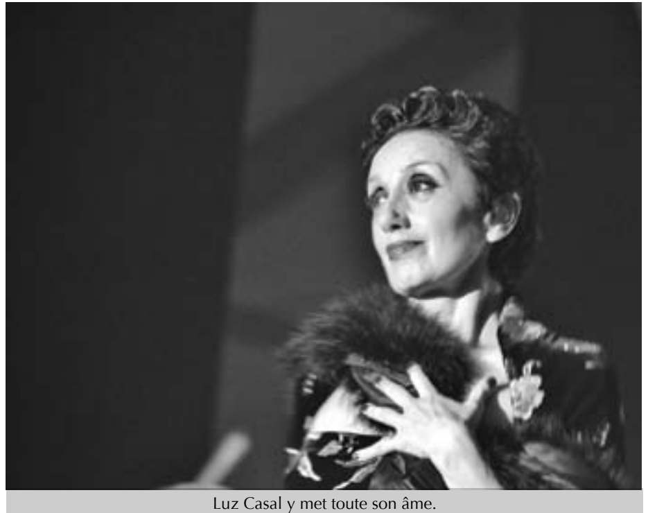
Luz Casal y met toute son âme.