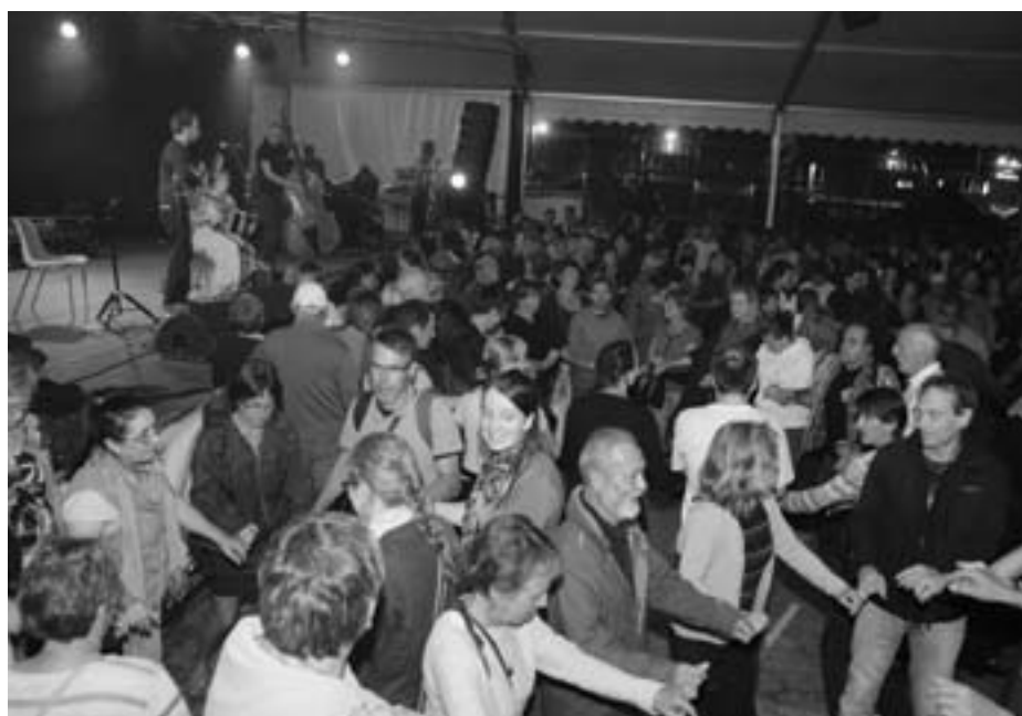
Toujours une ambiance bondissante avec les Irlandais.

Hier soir, c'était la musique du groupe Imosima qui faisait décoller les festivaliers. Dix ans déjà qu'ils animent avec une énergie toujours renouvelée les festoù noz. Laridés, cercles circassiens, suite de Loudéac, le public entre dans la danse, entre en transe, en cadence. Une contrebasse obsédante, un accordéon envoûtant, une guitare et des centaines de danseurs font vibrer