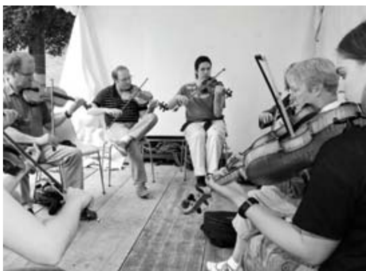
Au Village des Luthiers, les stages font fureur.